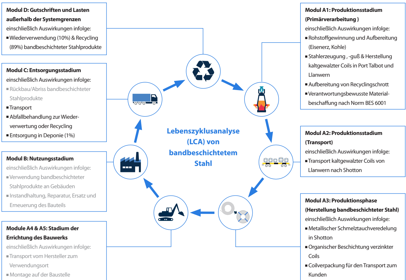
Abbildung 2 Lebenszyklusanalyse von bandbeschichtetem Stahl

Es wurden sämtliche Informationen aus dem Datenerhebungsprozess berücksichtigt, die alle verwendeten und registrierten Stoffe betreffen, sowie der gesamte Brennstoff- und Energieverbrauch. Emissionen am Standort wurden gemessen und berücksichtigt. Die Daten aller relevanten Produktionsstandorte wurden gründlich überprüft und ebenfalls miteinander abgeglichen, um potenzielle Datenlücken zu identifizieren. Es wurden keine Prozesse, Stoffe oder Emissionen, von denen bekannt ist, dass sie wesentlich zur Umweltwirkung des bandbeschichteten Stahlbands beitragen, vernachlässigt. Auf dieser Grundlage kann davon ausgegangen werden, dass keine Inputs oder Outputs, die einen Anteil von mehr als 1% an der Gesamtmasse oder -energie des Systems aufweisen oder umweltrelevant sind, ausgeschlossen wurden. Es wird davon ausgegangen, dass die Summe sämtlicher vernachlässigter Prozesse 5% der Wirkungskategorien nicht übersteigt. Die Herstellung der benötigten Anlagen und anderer Infrastruktur wird in der Lebenszyklusanalyse (LCA) nicht berücksichtigt.