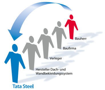
Abb.: Direkte Vertragsbeziehung zwischen Bauherr und Hersteller

Im Gegensatz zu anderen Garantien deckt Confidex® die werkseitig geschnittenen Kanten während der gesamten Garantiezeit ab und erfordert keine Inspektionen oder Wartungsarbeiten, um die Garantie zu validieren, außer wenn Colorcoat HPS200 Ultra® und Colorcoat Prisma® auf einem Dach und einer Wand verwendet wird, auf denen eine Photovoltaikanlage (PV) installiert ist.